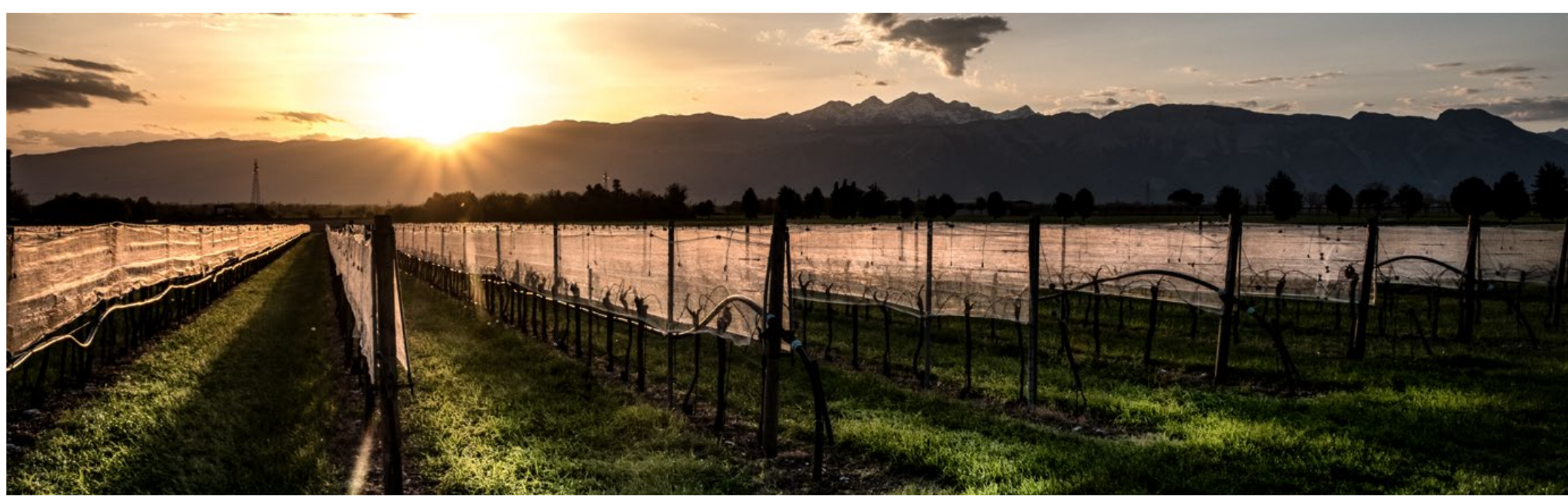
Danilo Rommel - Reti antigrandine a spalliera

Selezione dalla mostra di quadri dei pittori del Circolo "Per le antiche vie"