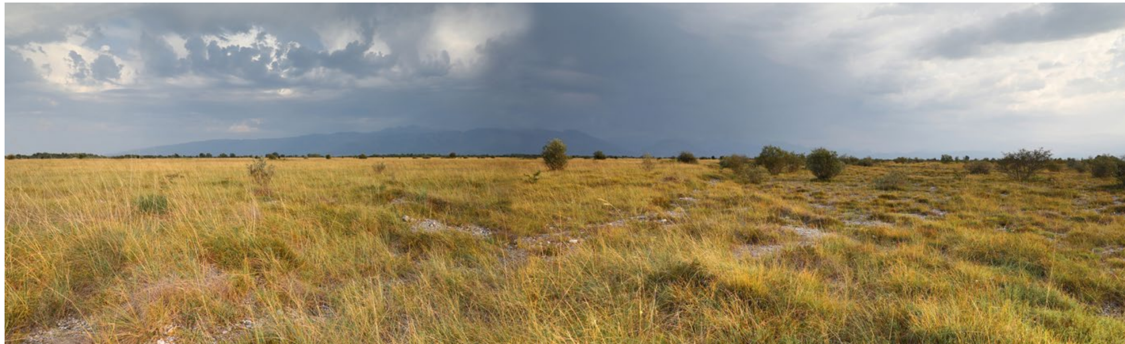
Sergio Vaccher - Paesaggio steppico - Magredi Friulani

Oltre 90 immagini dei fotografi naturalisti Danilo Rommel e Sergio Vaccher