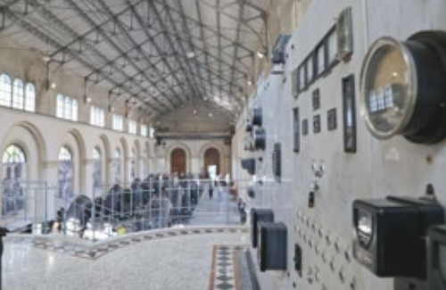
La sala macchine della centrale-museo di Malnisio